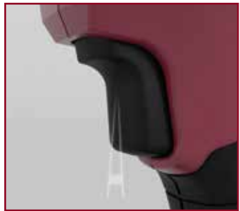
NEU: Rotations-Drücker mit sehr geringer Auslösekraft