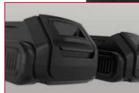
Kraftvoller Li-Ion Schiebeakku mit 12V, 16V oder 20V