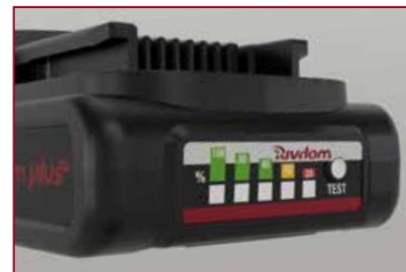
Optische Ladestandsanzeige auf jedem Akku

Die neuen 2,0Ah Li-Ion Akkus sind nach weniger als 30 Minuten voll geladen - die 90%-Ladung ist sogar schon nach ca. 20 Minuten erreicht, so dass der Ladezyklus immer kürzer als die verbrauchende Arbeitszeit ist!