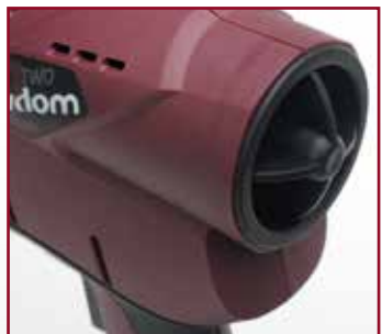
Mit Abdeckkappe zum Arbeiten ohne Auffangbehälter. Integrierte Stiftsicherung gemäß Maschinenrichtlinie