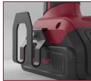
NEU: Praktischer Gürtelclip