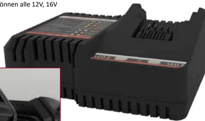
Hochwertiges Schnellladegerät für alle RivdomPLUS-Akkus: Ladezeit < 30 Minuten.