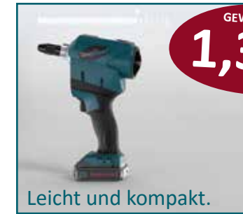
Leicht und kompakt.