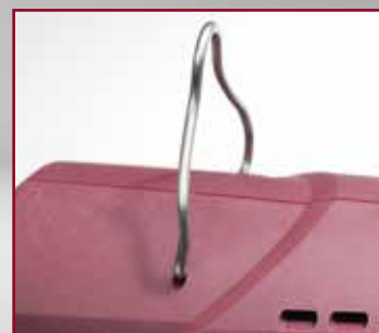
NEU bei RivdomONE/TWO: Aufhänger für Balancer

„Man merkt einfach, dass in diesem Werkzeug wirklich viel Erfahrung in Sachen Niet-Technik steckt... Alles in allem - für mich perfekt!“