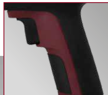
Hervorragende Ergonomie, geringes Gewicht, gummierter Handgriff.