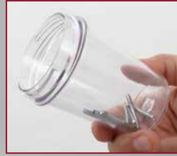
Robuster, transparenter Auffangbehälter